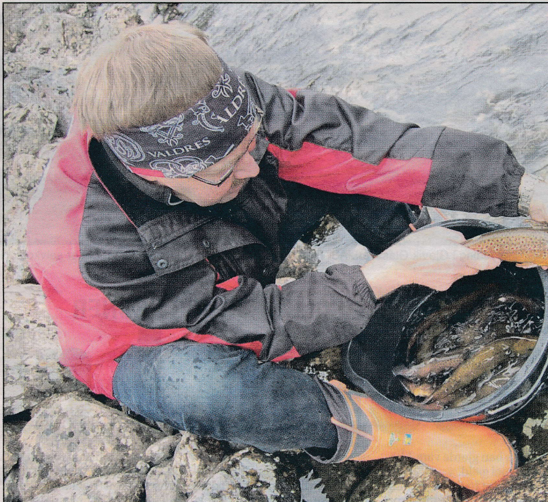
VELKOMMEN TILBAKE: Disse ørretene er klekt med rogn fra Begna, og føret opp i Torpa. Nå er de tilbake i Begna.

De 111 fiskene som ble satt ut i går, vil trolig spre seg over