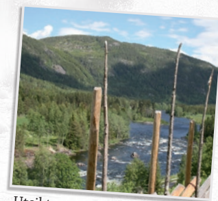
Utsikt mot Begna elv, sett fra Nissebakken