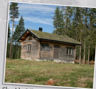
Skrukkefyllhaugen i Vassfaret