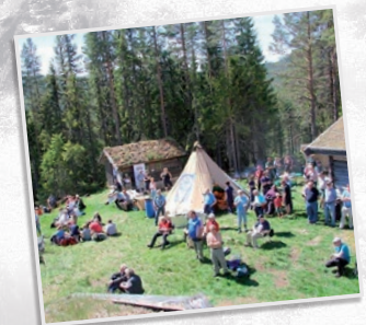
Vassfardagen 2015 på Skrukkefyllhaugen