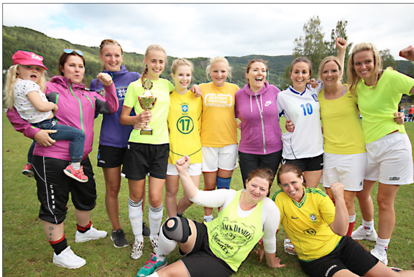
Vinnerne av vandrepokalen i dameklassen, Vestre Bagn.