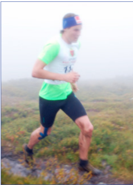
Even suveren vinner.