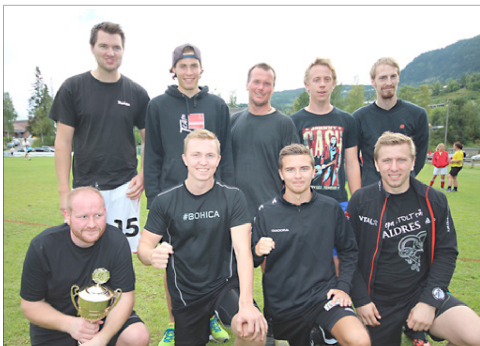
Vinnerne av vandrepokalen i herreklassen, Hølera

Som vanlig var det satt opp vandrepokaler i dame- og herreklassene. Østre Bagn vant både herre- og dameklassen i 2014, men i år måtte de levere pokalene videre til nye vinnere. Vestre Bagn var sterkest i dameklassen og Hølera trakk til slutt det lengste strået i herreklassen, på målforskjell, etter at tre lag sto helt likt både på antall poeng og innbyrdes oppgjør.