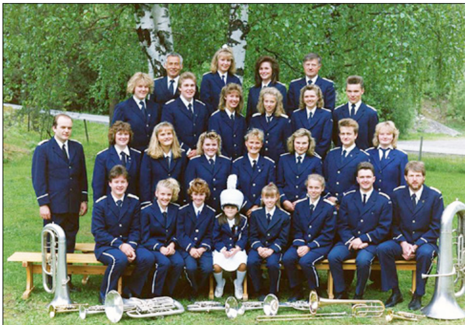
Bagn musikkorps anno 1989.

Bagn musikkorps fyller 100 år den 5. desember 2015. Jubileet feires med stor konsert på SAUS lørdag 14. november. Det blir en variert konsert med både musikalske innslag og diverse muntre betraktninger fra sidelinja.